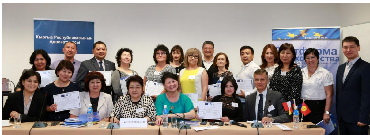
Около 20 волонтеров-членов Адвокатуры КР присоединились к Инициативе на бесплатной основе

Инициатива «Введение в право для школьников Кыргызстана» была запущена в октябре 2015 г. и направлена на обучение адвокатов Кыргызстана разработке модулей для повышения правовой информированности учащихся кыргызских школ в возрасте от 9 до 17 лет. Подход, используемый в рамках данной инициативы, финансируемой ЕС, был разработан Парижской коллегией адвокатов и в настоящее время применяется во Франции. На сегодняшний день он успешно используется в 18 государствах-членах Европейского Союза.